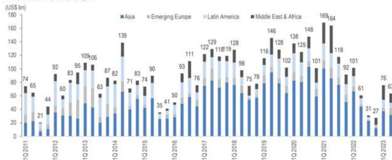
EM corporate quarterly supply by region